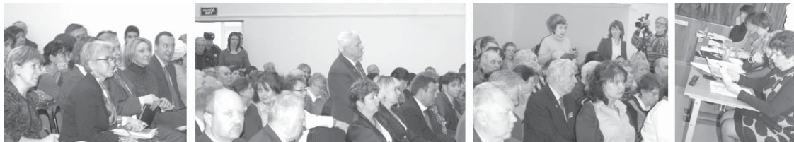
Окончание. Начало на стр. 1

Разгрузить амбулаторную сеть поможет новая поликлиника в 20-м микрорайоне, а расширить возможности получения медпомощи — открытие в 2015-м году детской больницы на 300 коек с поликлиническим отделением. В частных случаях, когда человек не может попасть на прием к врачу или получить справку, руководитель Дирекции здравоохранения поощряет разбраться лично.